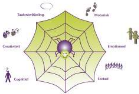
KDV en POV